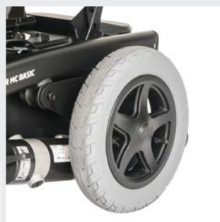
Pneus gonflés avec protection contre les crevaisons