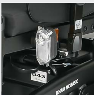
Éclairage LED durable