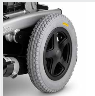
Pneus avec protection contre les crevaisons