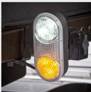
Éclairage LED à longue durée de vie