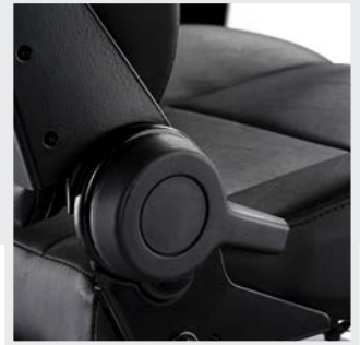
Siège de luxe à réglage progressif