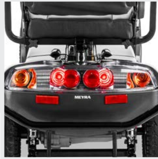
Moteur de 700/3 000 watts