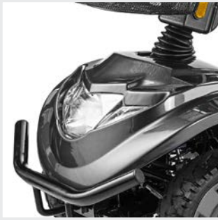
Technique LED ultramoderne